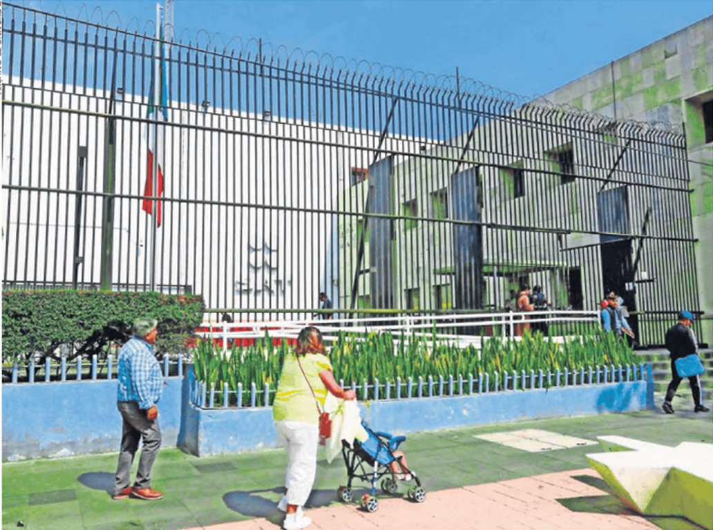
Para todo el presente ejercicio se tiene programado captar un total de 5.2 billones de pesos, de acuerdo con la Ley de Ingresos de la Federación aprobada por el Congreso de la Unión.

COMUNICADO DEL SERVICIO DE ADMINISTRACIÓN TRIBUTARIA