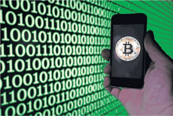
La plataforma de pagos permite a cualquier persona intercambiar, almacenar o transferir criptomonedas como el Bitcoin.

Nos hacen ver que no es casualidad que Moody's Ratings, que preside Michael West , ratificara todas las calificaciones y evaluaciones asignadas a Santander en Chile, que incluye las asignaciones de depósitos de largo y corto plazo. Las buenas notas incorporan la diversificación de ingresos y la eficiencia operativa de la institución, derivadas de su sólida posición en el sistema chileno, como el mayor banco en términos de préstamos y el segundo en cuanto a depósitos. Nos platican que la empresa de origen español está en todas partes en el país sudamericano, prácticamente tapiando de rojo cada rincón. Además, cuenta con una amplia diversificación de negocios que históricamente ha respaldado sólidos fundamentos crediticios, lo que le permite gestionar ciclos económicos negativos y una exposición aún elevada a préstamos problemáticos.